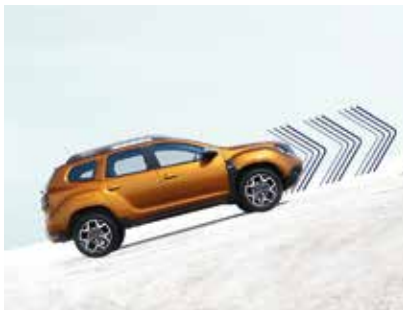
HILL START ASSISTANCE

Είτε οδηγείτε σε οριοθετημένους δρόμους είτε χαρτογραφείτε άγνωστα εδάφη, το νέο Dacia Duster ξέρει καλά πώς να ανταποκριθεί σε κάθε περίπτωση. Το σύστημα υποβοήθησης εκκίνησης σε δρόμο με κλίση (Hill Start Assist) εξασφαλίζει άριστη συγκράτηση και στις πιο απότομες ανηφόρες ή κατηφόρες, ενώ το σύστημα ελέγχου κατάβασης (Hill Descent Control) εξασφαλίζει τον έλεγχο της ταχύτητάς σας. Και επειδή μερικές φορές ίσως δυσκολεύεστε να βλέπετε τα πάντα γύρω σας, η κάμερα Multiview ανιχνεύει λακκούβες, πέτρες ή μικρά εμπόδια εξασφαλίζοντάς σας ομαλή και ασφαλή διαδρομή.