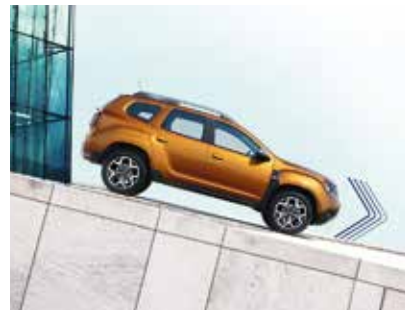
HILL DESCENT CONTROL