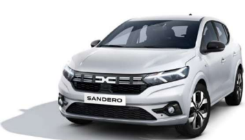
ΛΕΥΚΟ GLACIER (1)