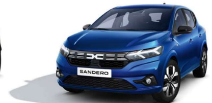
ΜΠΛΕ IRON (3)