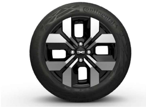
16" ΖΑΝΤΕΣ ΑΛΟΥΜΙΝΙΟΥΥ RANΔΙΑ (προαιρετικός εξοπλισμός)