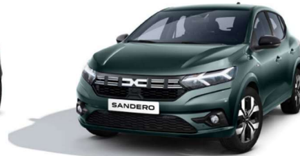
ΠΡΑΣΙΝΟ CEDAR (3)