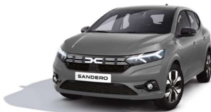
ΓΚΡΙ URBAN (3)