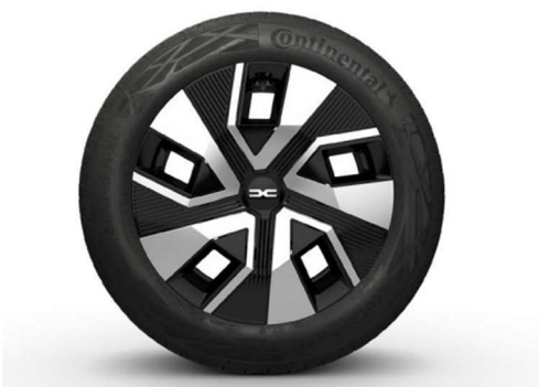
16" ΤΡΟΧΟΙ FLEXWHEEL ATARA