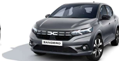
ΓΚΡΙ SCHISTE (3)