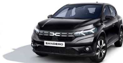
ΜΑΥΡΟ PEARL (2)