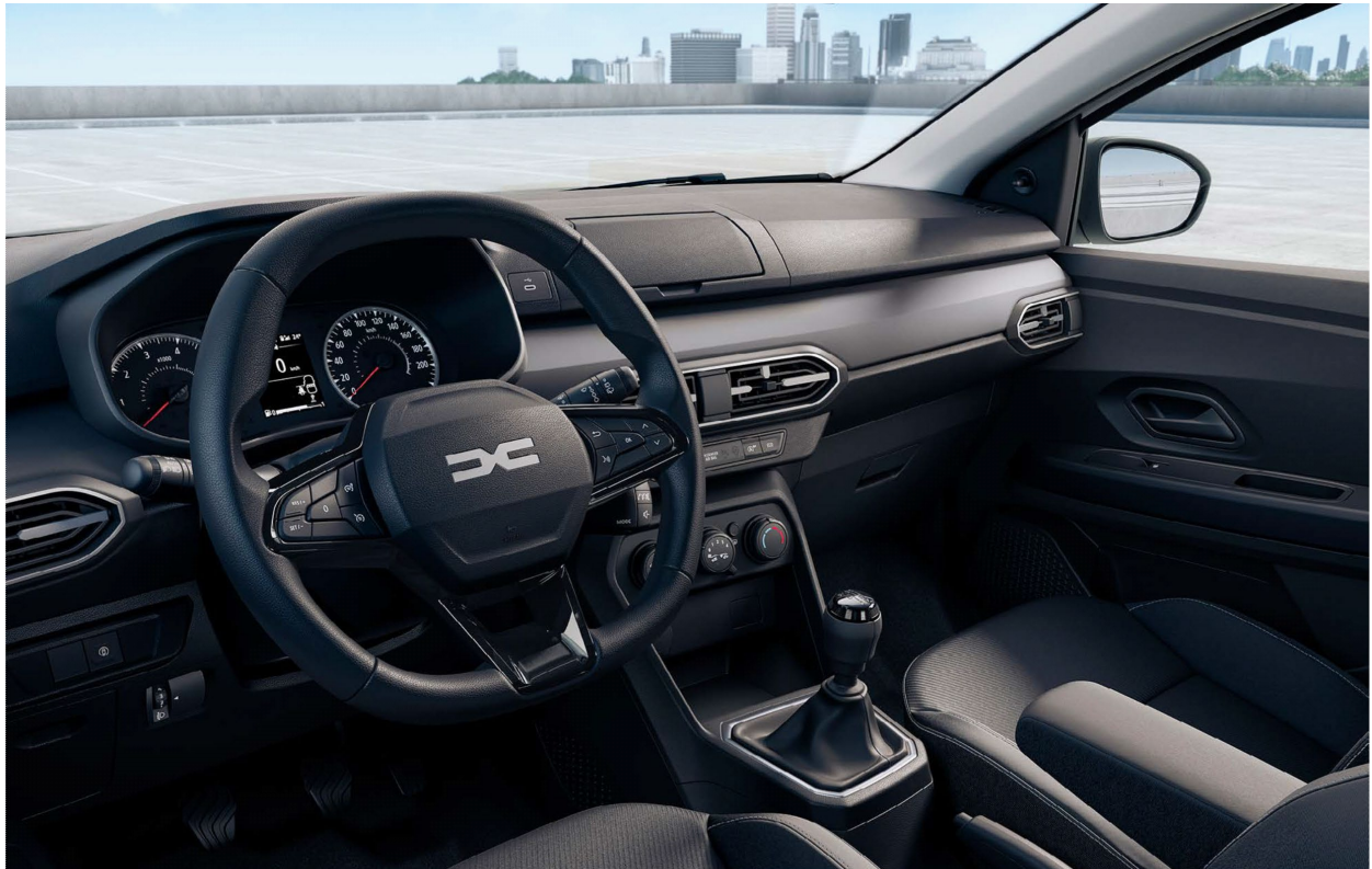
Πίνακα οργάνων με οθόνη 3,5" & Σύστημα πολυμέσων Media Control