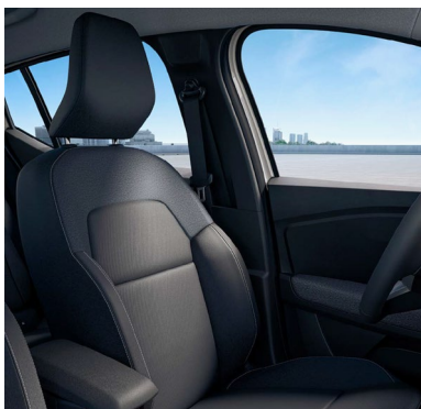
Υφασμάτινες επενδύσεις καθισμάτων