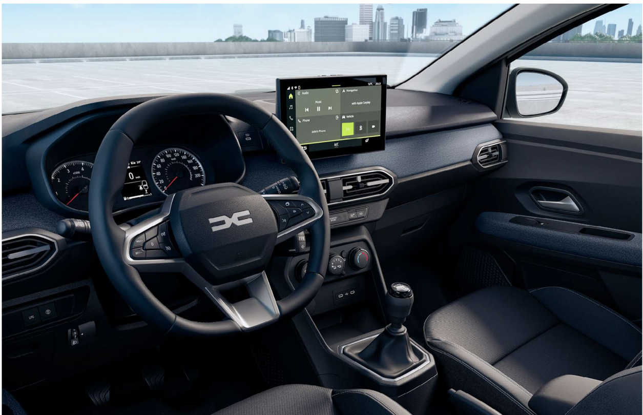
Ψηφιακός πίνακας οργάνων 3,5" & Σύστημα πολυμέσων Media Display 10,1"