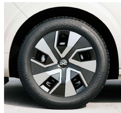
Τροχοί 16" & ελαστικά 195/55 R16