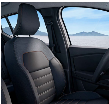
Υφασμάτινες επενδύσεις καθισμάτων