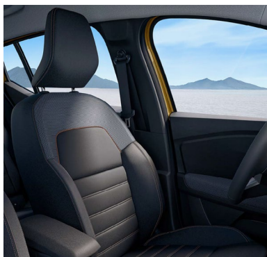
Υφασμάτινες επενδύσεις καθισμάτων