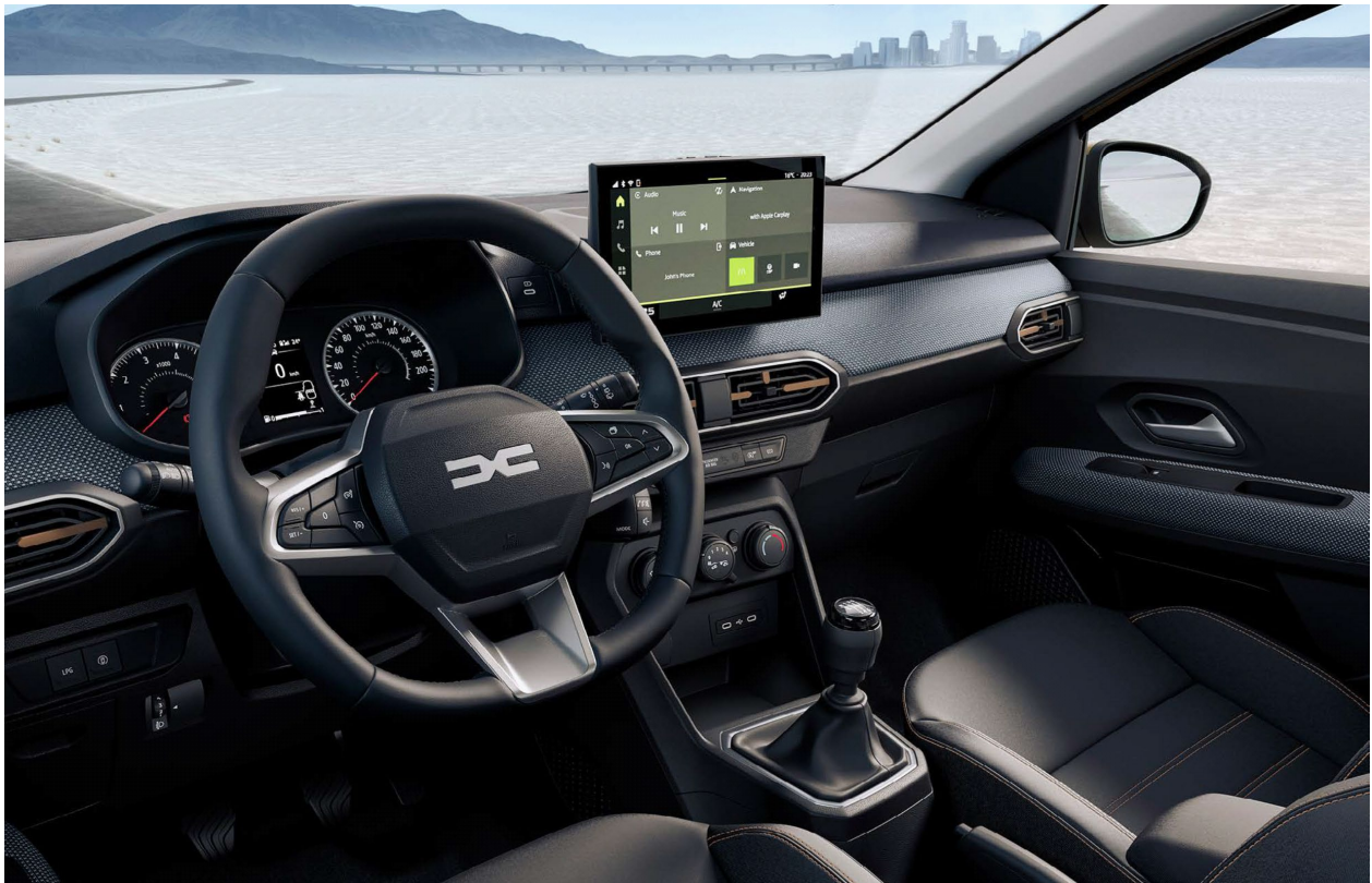
Ψηφιακός πίνακας οργάνων 3,5" & Σύστημα πολυμέσων Media Display 10,1"