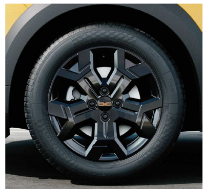
Τροχή 16" & ελαστικά 205/60 R16