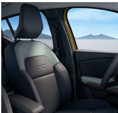
Υφασμάτινες επενδύσεις καθισμάτων