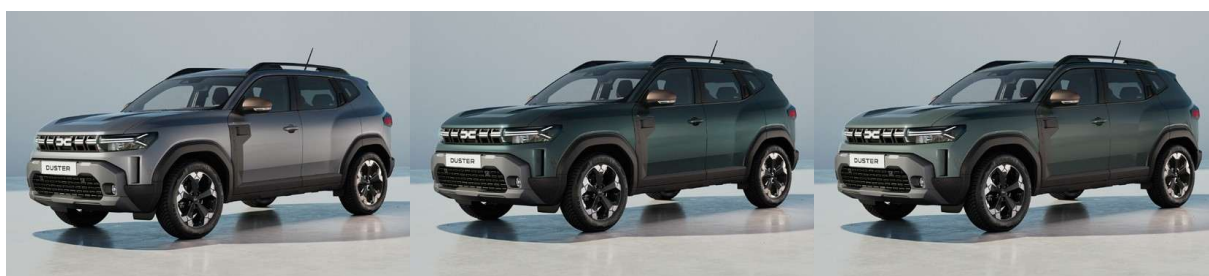
Γκρι Schiste (2)