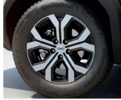
17" ζάντες αλουμινίου TERGAN diamond-cut, ελαστικά 215/65 R17