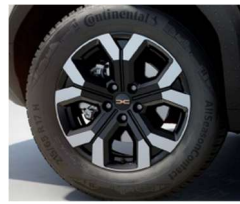
17" ζάντες αλουμινίου TERGAN semi diamond-cut, ελαστικά 215/65 R17