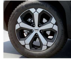
18" ζάντες αλουμινίου TAGASAN diamond-cut, ελαστικά 215/60 R18