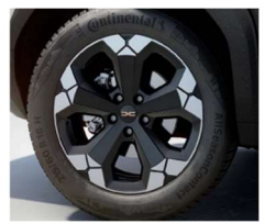
18" ζάντες αλουμινίου TAGASAN semi diamond-cut, ελαστικά 215/60 R18