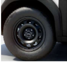
16" τροχοί, ελαστικά 215/70 R16