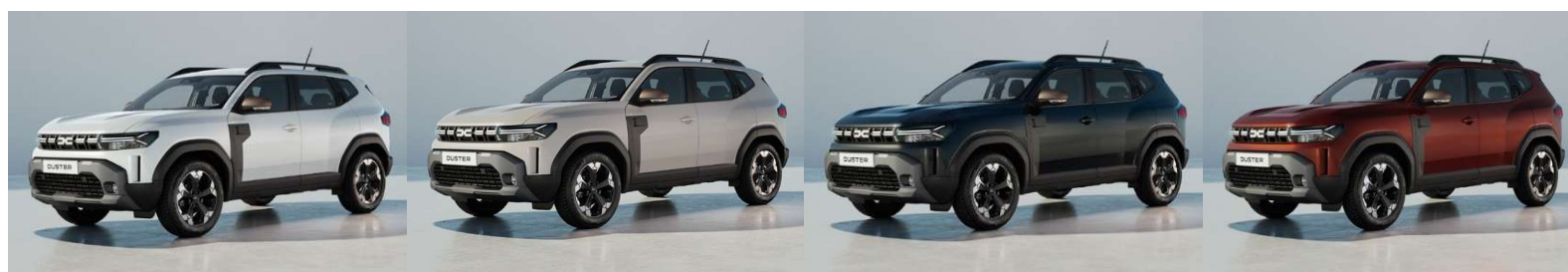
Λευκό Glacier (1)